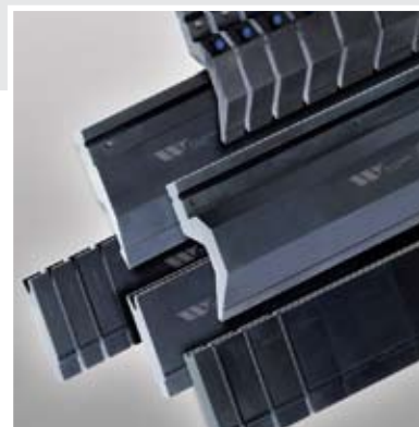
Estilo Precision WT™